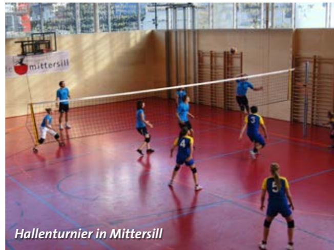
Hallenturnier in Mittersill

Ein großes Dankeschön gilt auch der Firma Holzbau Maier die uns eine neue Dress gesponsert hat.