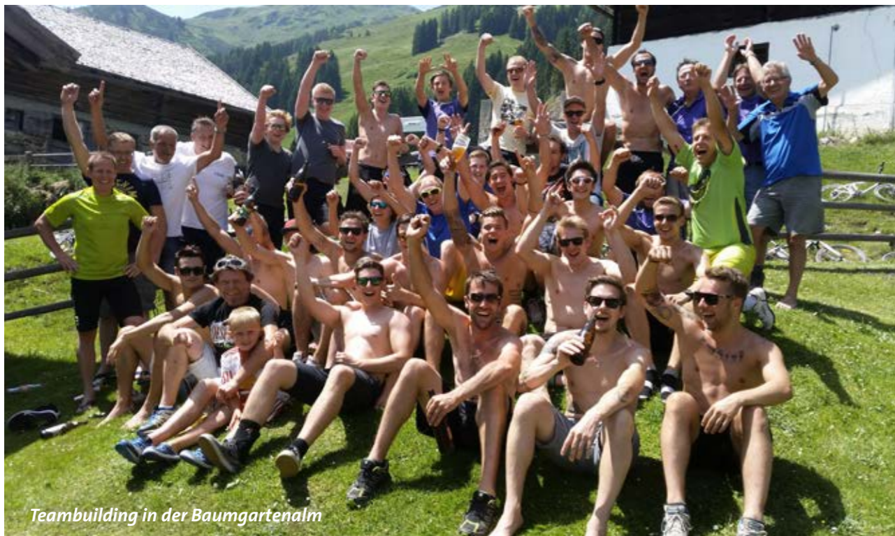
Teambuilding in der Baumgartenalm

Wir bildeten einen „Sektionsleiter-Spielerrat“ um wichtige Entscheidungen, vorher in einer kleinen Gruppe zu besprechen. Dieser Sektionsleiter-Spielerrat besteht Großteils aus Führungsspielern des SCM.