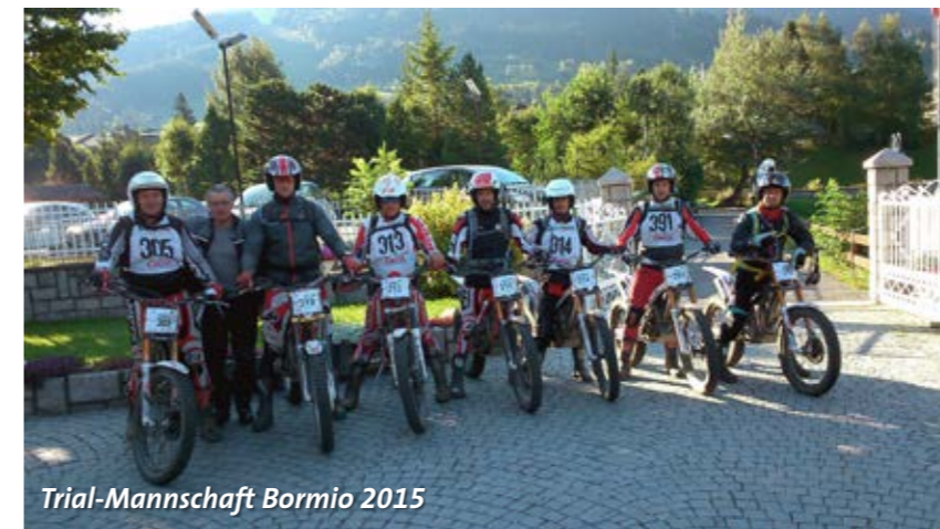
Trial-Mannschaft Bormio 2015

WIR WÜNSCHEN ALLEN AKTIVEN FÜR DIE TRIALSAISON 2016 VIEL ERFOLG.