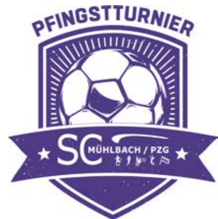
Unser neues Pfingstturnierlogo

Wie immer möchte ich mich zum Schluss bei allen Anrainern, allen Helfern und Unterstützern die uns das ganze Jahr tatkräftig zur Hand gehen, bedanken.