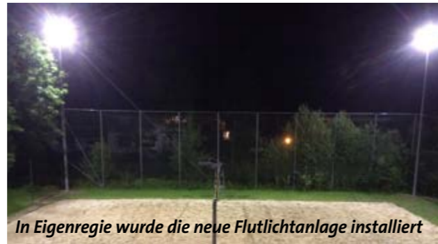
In Eigenregie wurde die neue Flutlichtanlage installiert

Der Volleyball Club Mühlbach kann auf ein sehr erfolgreiches Jahr 2016 zurückblicken. Nach dem unglücklichen Verpassen des oberen Play Offs der Hallensaison 2015/16, wo nur ein Sieg zum Aufstieg fehlte, konnte im unteren Play Off der ausgezeichnete 1. Platz erspielt werden. Damit beendete unsere Mannschaft die Jahres-Gesamtwertung in der Halle auf dem 5. Platz.