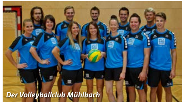
Der Volleyballclub Mühlbach