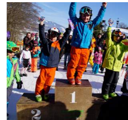
Siegerehrung der Kinder

auch an die Feuerwehr Bramberg (vor allem Nindl Manfred und Rammler Manfred) für ihren Einsatz zur Pistenpräparierung.