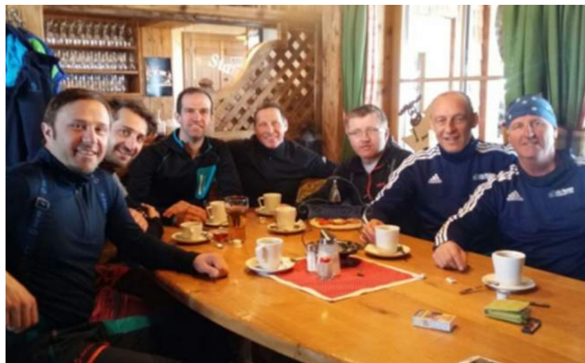
Alte Herren Skifahrer

Gute Erkenntnisse konnten vom AH Turnier in Thurn/Lienz – Sieg gegen Reserve SCM, Spiel gegen Bramberg sowie dem Sieg gegen Kaprun – gewonnen werden.