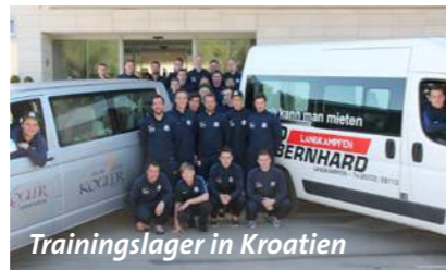
Trainingslager in Kroatien

Bei der Hallenlandesmeisterschaft schnitt unsere Mannschaft hervorragend ab. Die Vorrunde in Mittersill wurde gewonnen , die Zwischenrunde in Bischofshofen beendeten wir auf dem 4. Platz und wurden somit beste Pinzgauer Mannschaft .