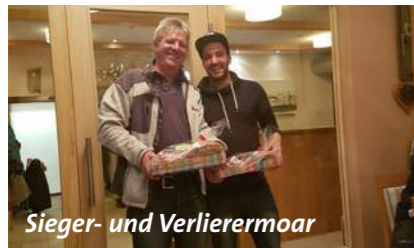
Sieger- und Verlierermoar

Der Kader wurde im vergangenen Winter nicht verändert. Der offizielle Trainingsstart erfolgte am 09.01.2017. In der Winter Vorbereitung wurde 4-mal pro Woche trainiert. Dabei wurden Laufeinheiten und Zirkeltrainings, mit unserem Konditionstrainer „Marshall“ kombiniert. Dieses Training wurde jetzt schon das 2. Jahr so gestaltet und es fand bei den Spielern großen Zuspruch. Deshalb ist dieses Training auch heuer wieder fixer Bestandteil unserer Winter Vorbereitung.