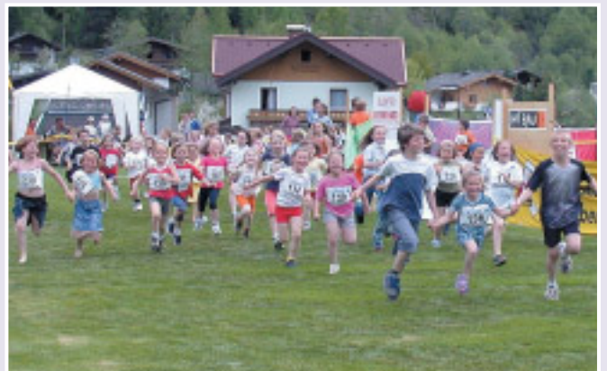
Der Hopsi-Hopper-Kinderlauf ist jedes Jahr das sportliche Großereignis in der Region.