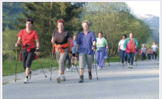
Voll im Trend – der neue Fitnesssport Nordic Walking

Aktiv gesund – gemeinsam einen Anlauf nehmen! Es freut uns, dass es uns mit diesen Veranstaltungen gelungen ist, eine große Bevölkerungsschicht aller Altersgruppen anzusprechen.