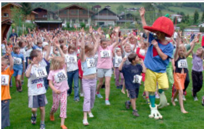
Fit und locker an den Start

„Hopsi Hopper immer fair – beim Spiel geht’s niemals ruppig her“, heißt es dann beim anschließenden Spielefest. Der Hopsi Hopper Kinderlauf wird von zahlreichen Sponsoren und vom ASKÖ-Fit Referat großzügig unterstützt.