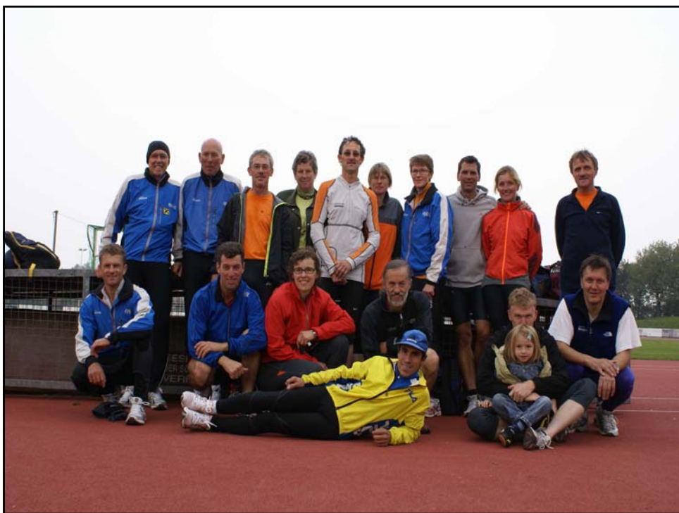
Unsere Traininggruppe/ Sportanlage Mauth

Zum Abschluss von unsrem Sportwochenende begaben wir uns noch in „luftige Höhen“. Im Hochseilgarten in Haag am Hausruck waren zahlreiche Passagen am „seidenen Faden“ zu überwinden. So mancher war froh am Ende des Parcours wieder festen Boden unter den Füßen zu spüren.