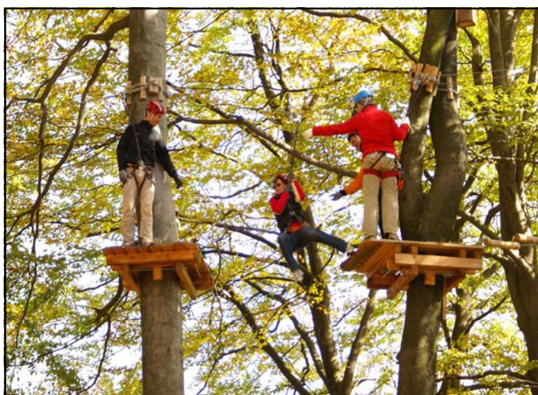
Hochseilgarten Haag am Hausruck