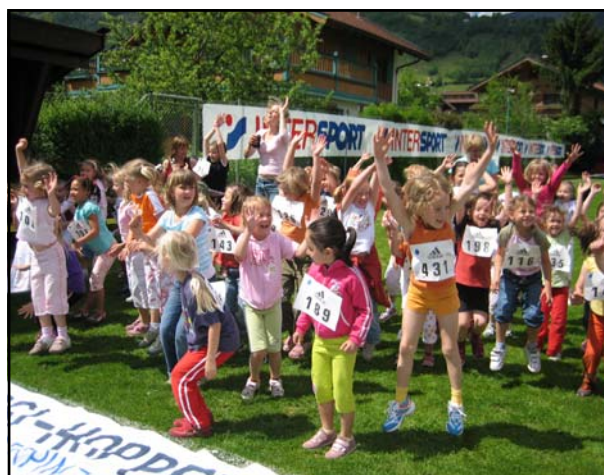
Fit und locker mit Hopsi Hopper