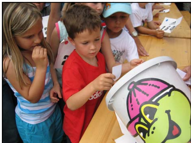
Hopsi Hopper Glücksbox, jedes Kind gewinnt