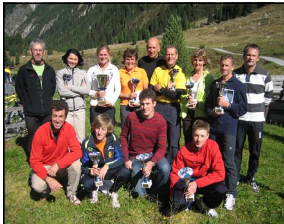
Das erfolgreiche Team des LC-Oberpinzgau