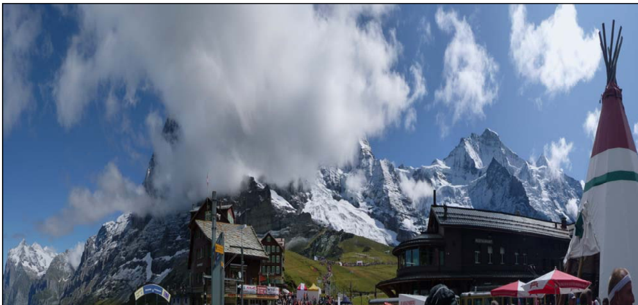
Ziel bei der kleinen Scheidegg