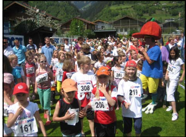
Hopsi Hopper Parade

Hopsi Hopper bedankt sich bei allen Sponsoren und Helfern, die die Veranstaltung großzügig unterstützt haben!