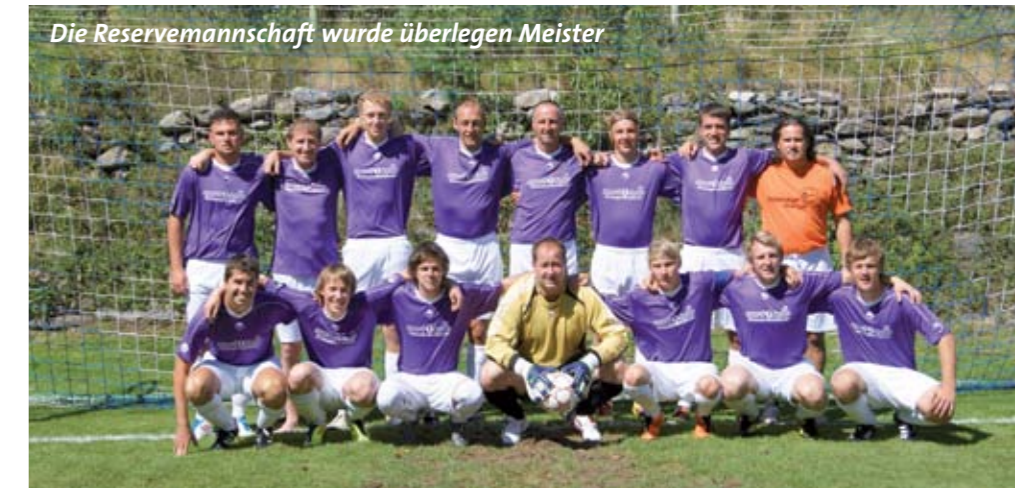
Die Reservemannschaft wurde überlegen Meister