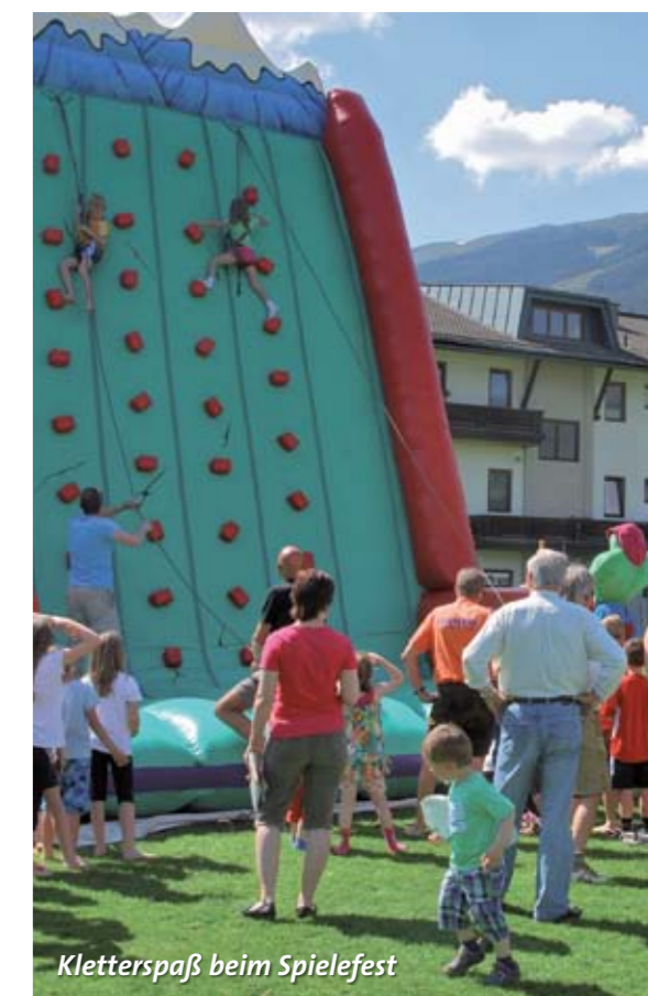
Kletterspaß beim Spielefest

Hopsi Hopper bedankt sich bei allen Helfern und Sponsoren für die großzügige Unterstützung der großen Kindersportveranstaltung.