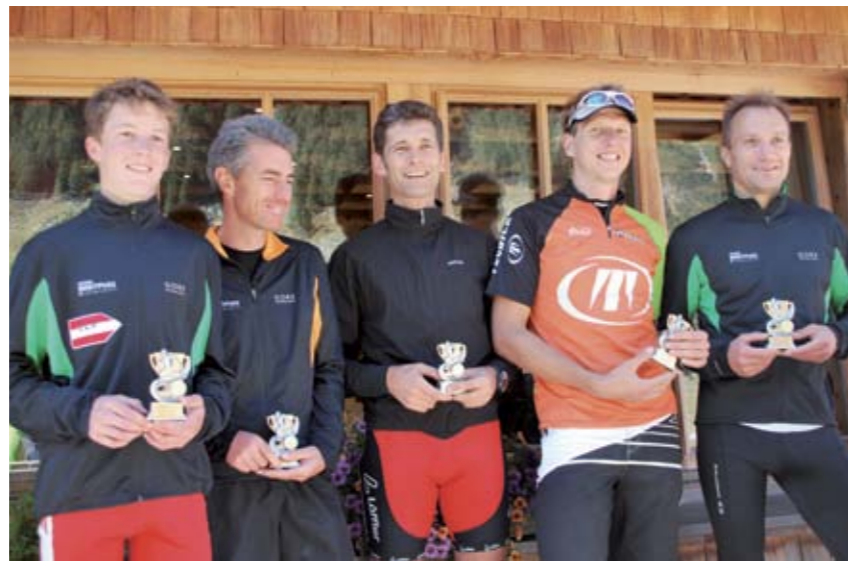
Sieg in der Mannschaftswertung Krimmler Lauf 2011

Beim 15. Krimmler Wasserfalllauf gingen heuer über 100 LäuferInnen an den Start. Die Strecke führte vom Krimmler Ortszentrum über den Wasserfallweg zur Hölzlaneralm und weiter zum Krimmler Tauernhaus. Eine Streckenlänge von 14 km und 650 Höhenmeter waren zu bewältigen.