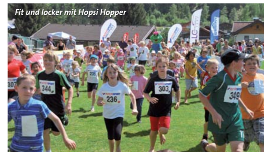
Fit und locker mit Hopsi Hopper

„Fit und locker mit Hopsi Hopper“ so lautete auch heuer wieder das Motto vom Kinderlauf der vom Laufclub Oberpinzgau gemeinsam mit dem ASKÖ-Fit Referat bereits zum 16. mal in Bramberg auf dem Sportplatz Mühlbach veranstaltet wurde. Hopsi Hopper, heuer in neuem Outfit, konnte wieder über 300 Kinder bei herrlichem Frühlingswetter am Start begrüßen.