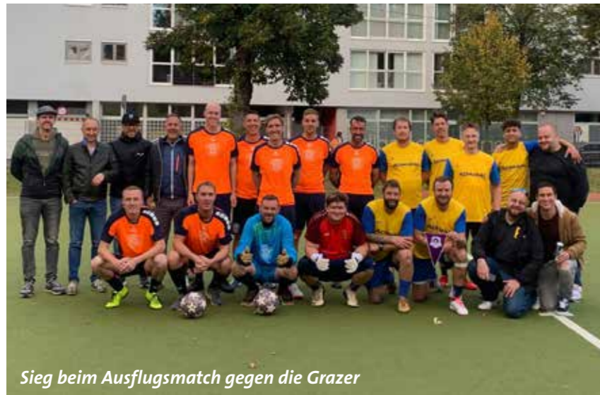
Sieg beim Ausflugsmatch gegen die Grazer

Wir möchten uns wieder beim Vorstand vom SCM für die gute Zusammenarbeit bedanken. Ebenso den Damen von der Kabinenreinigung gebührt unser Dank.