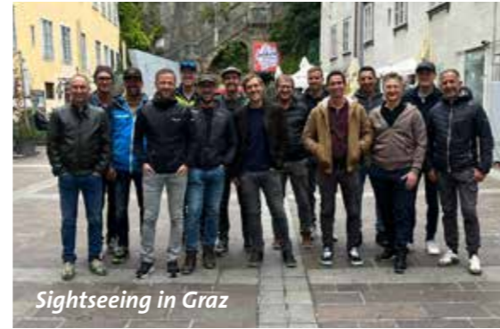
Sightseeing in Graz

Ein weiteres Kleinfeldturnier wurde in Bramberg am neuen Mehrzweckplatz bestritten.