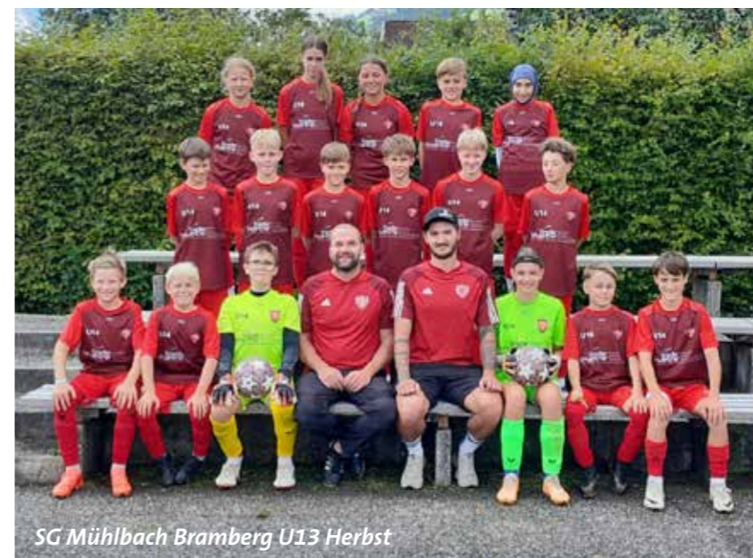
SG Mühlbach Bramberg U13 Herbst

SCHÖNE WEIHNACHTEN UND EIN GLÜCKLICHES UND VOR ALLEM GESUNDES NEUES JAHR 2025 WÜNSCHT DER NACHWUCHS DES SCM