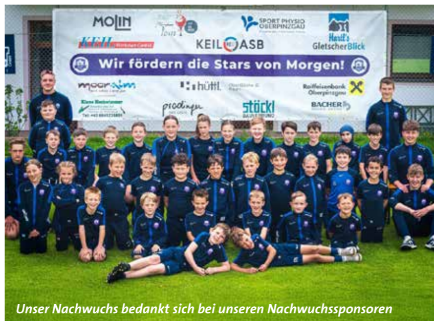
Unser Nachwuchs bedankt sich bei unseren Nachwuchssponsoren