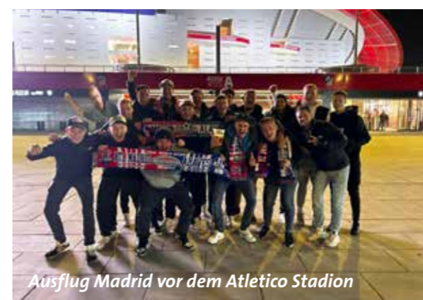
Ausflug Madrid vor dem Atletico Stadion

Am Ende der Saison 2023/2024 belegten wir den 12. Tabellen-