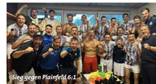
Sieg gegen Plainfeld 6:1