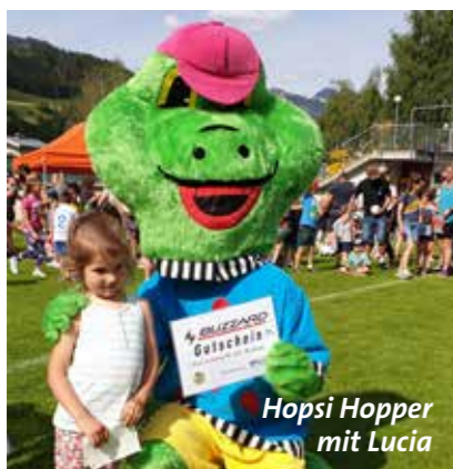
Hopsi Hopper mit Lucia