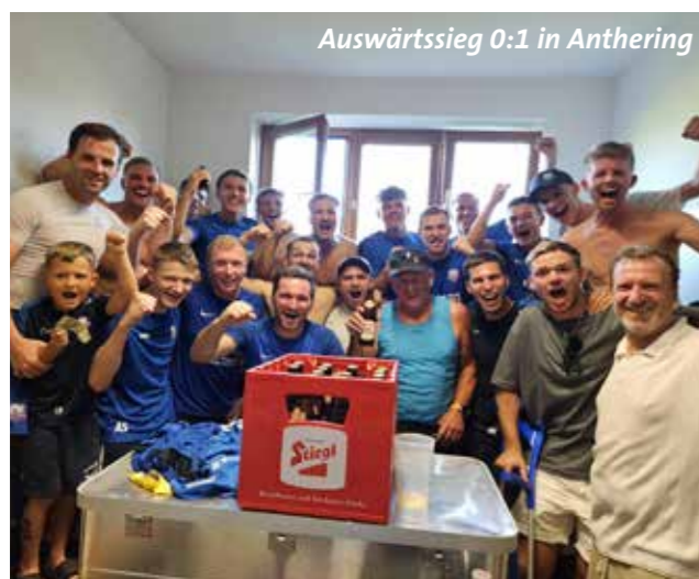
Auswärtssieg 0:1 in Anthering