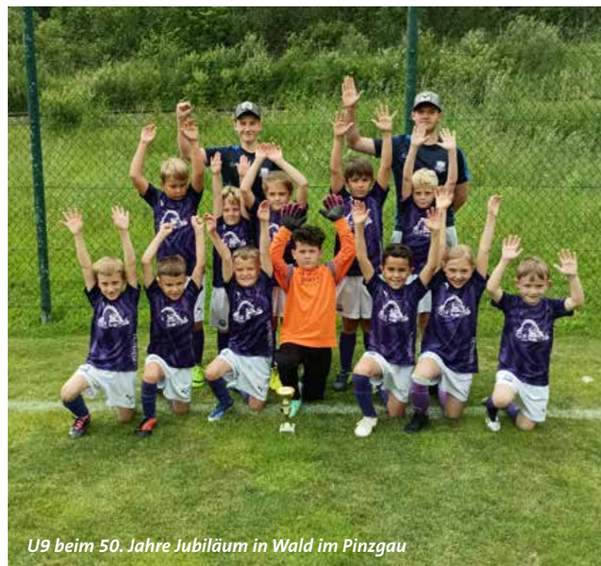
U9 beim 50. Jahre Jubiläum in Wald im Pinzgau

SCHÖNE WEIHNACHTEN UND EIN GLÜCKLICHES UND VOR ALLEM GESUNDES NEUES JAHR 2025 WÜNSCHT DER NACHWUCHS DES SCM