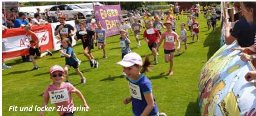
Fit und locker Zielsprint

Unser Dank gilt den zahlreichen Sponsoren und Helfern! Wir freuen uns bereits auf den 24. Mai 2025 , wenn es wieder heißt: „ Fit und locker mit Hopsi Hopper! “